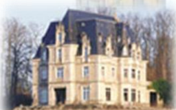
Château de Guéville