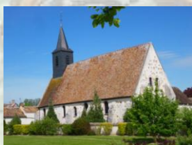
Église de Gravon